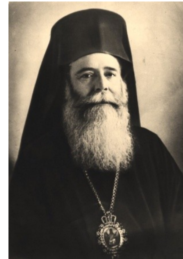
Μητροπολίτης Τραπεζούντος Χρυσάνθος (1881-1949) Πρόεδρος Ε.Π.Μ. (1927-1949)

(Ψήφισμα Διεθνούς Συνεδρίου Διαλεκτολογίας, Μάρμπουργκ Δυτικῆς Γερμανίας, Σεπτέμβριος 1965)