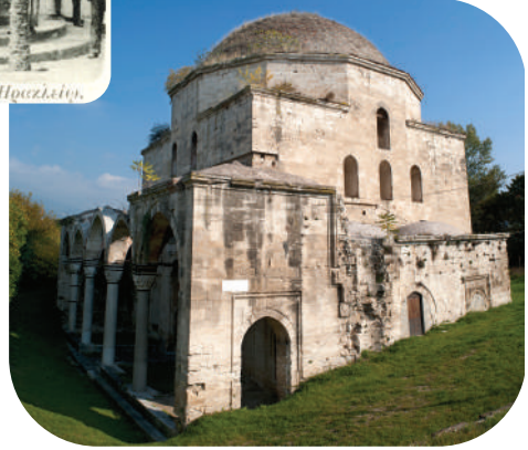
Αρχαίον της Ηρακλείας.