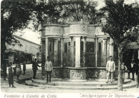
Fontaine à Candie de Crète.

Tarihte Görünmez Kentler: Girit, 19. - 20. Yüzyıllar