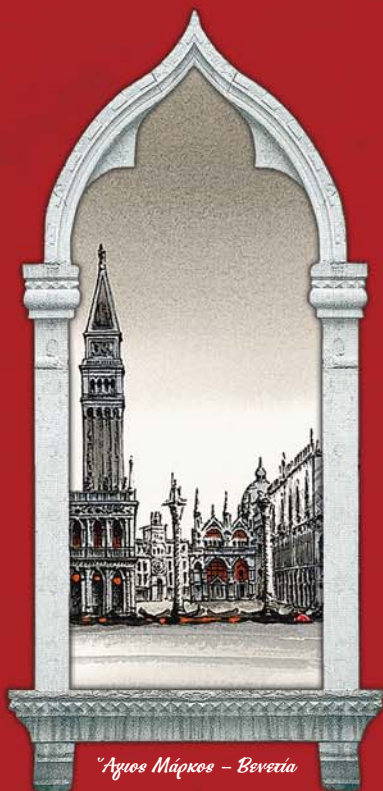
Ἅγιος Μάρκος - Βενετία