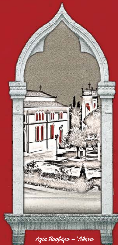
Ἁγία Βαρβάρα - Ἀθήνα

πρὶν 1000 μετὰ Κωνσταντινούπολη - Βενετία χρόνια Βενετία - Ἀθήνα